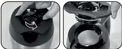
Girar em sentido anti-horário (figura1) para abrir a tampa (figura2)

posicionar a jarra no aparelho, adicionar o pó de café e ligar a cafeteira. Esse procedimento fará com que a água quente pré aqueça a jarra melhorando sua eficiência térmica.