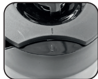
Para fechar a tampa alinhe a seta da tampa com a indicação da jarra e gire em sentido horário (Figura3)

O café tende a perder calor rapidamente quando servido em dias muito frio, o mesmo pode acontecer quando for servido em pouca quantidade e em xícaras muito grande, neste caso; recomenda-se utilizar xícaras com tamanho apropriado à dose do café desejado e consumir o café logo após seu preparo, ou ainda, servir uma quantidade maior de café.