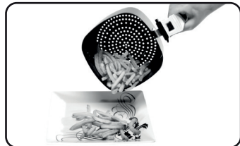
Imagens meramente ilustrativas.

12. Esvazie o cesto em um recipiente ou um prato.