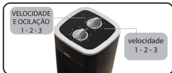
Figura 1. Seletor liga/desliga/velocidade/oscilação

. Para ligar seu ventilador, ligue o plugue na tomada, escolha a velocidade desejada no seletor de liga/desliga e velocidade (01) observe que tem marca 1-2-3 para os lados do seletor o lado direito você somente escolhe a velocidade do vento, já para o lado esquerdo você escolhe a velocidade do vento com oscilação 90° (Figura1 e Figura2).