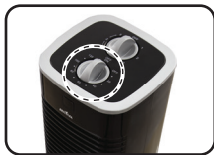
Figura 3. Seletor Timer

Caso queira regular o tempo de funcionamento, girar o interruptor do timer no sentido horário até a posição desejada e o ventilador será desligado automaticamente quando acabar o tempo escolhido. Girar o botão no sentido anti-horário até a opção (off) para desligar o aparelho e o timer (Figura 3) .