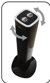
Figura 2. Movimento de Oscilação