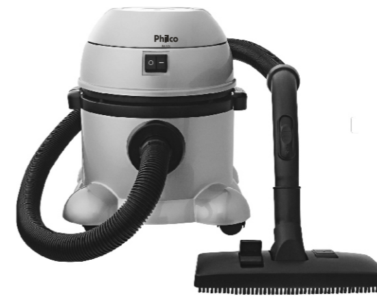
Aspirador PA 10L