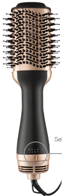
Seletor de Velocidade e Temperatura