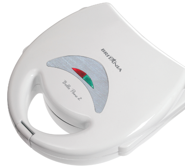
Sanduicheira Bello Pane 2 MANUAL DE INSTRUÇÕES

ESTE DESENHO É PROPRIEDADE EXCLUSIVA DA BRITÂNIA ELETRDOMÉSTICOS LTDA. E NÃO PODERÁ SER UTILIZADO POR TERCEIROS