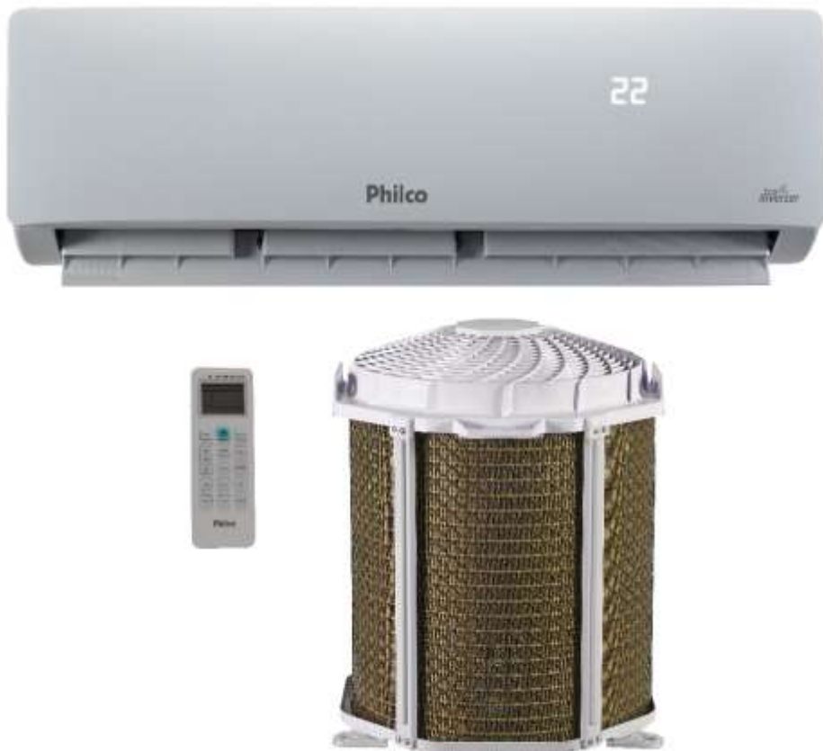
IMAGEM DE REFERÊNCIA PAC9000ITFM12W