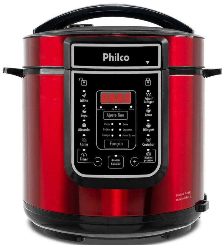
Panela de Pressão Digital Inox Red 6L