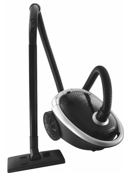
Manual de Instruções