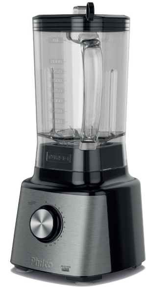
LIQUIDIFICADOR PLQ2100I TURBO

PARABÉNS, VOCÊ ACABA DE ADQUIRIR UM PRODUTO DE QUALIDADE PHILCO! Para garantir o melhor desempenho e durabilidade de seu produto, recomendamos que leia todo o manual antes de utilizá-lo e guarde-o para eventuais consultas. Este é um manual unificado e atende todas as versões da linha de liquidificadores PLQ2100 TURBO.