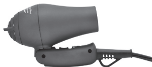
DETALHE DO CABO DOBRÁVEL