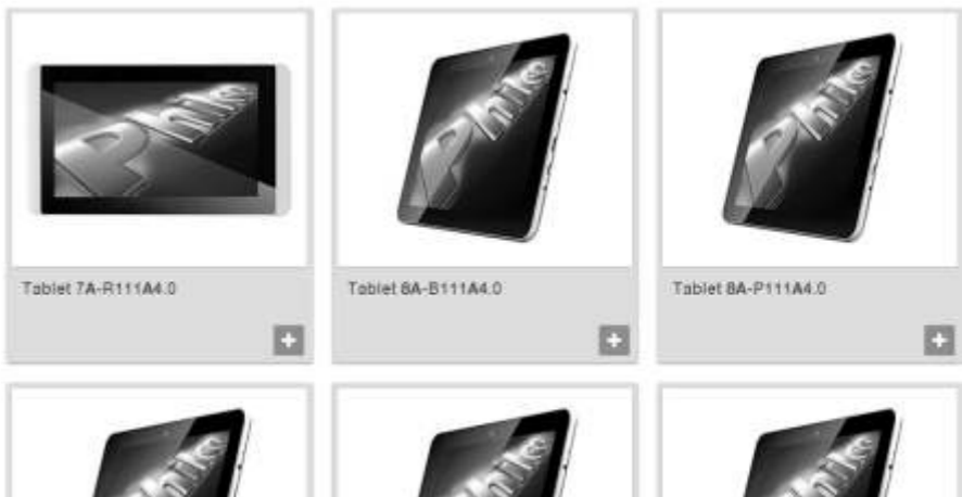
Imagens meramente ilustrativas.