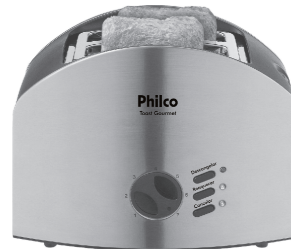
Torradeira Toast Gourmet