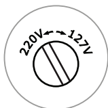
DETALHE DA CHAVE SELETORA DE TENSÃO