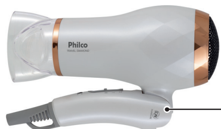
DETALHE DO CABO DOBRÁVEL