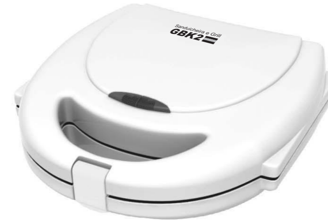
Sanduicheira & Grill GBK 2 MANUAL DE INSTRUÇÕES