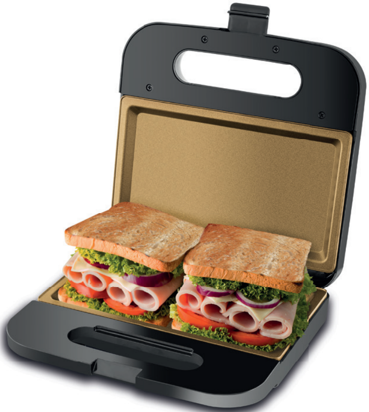
Imagens meramente ilustrativas.