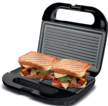
Imagens meramente ilustrativas.