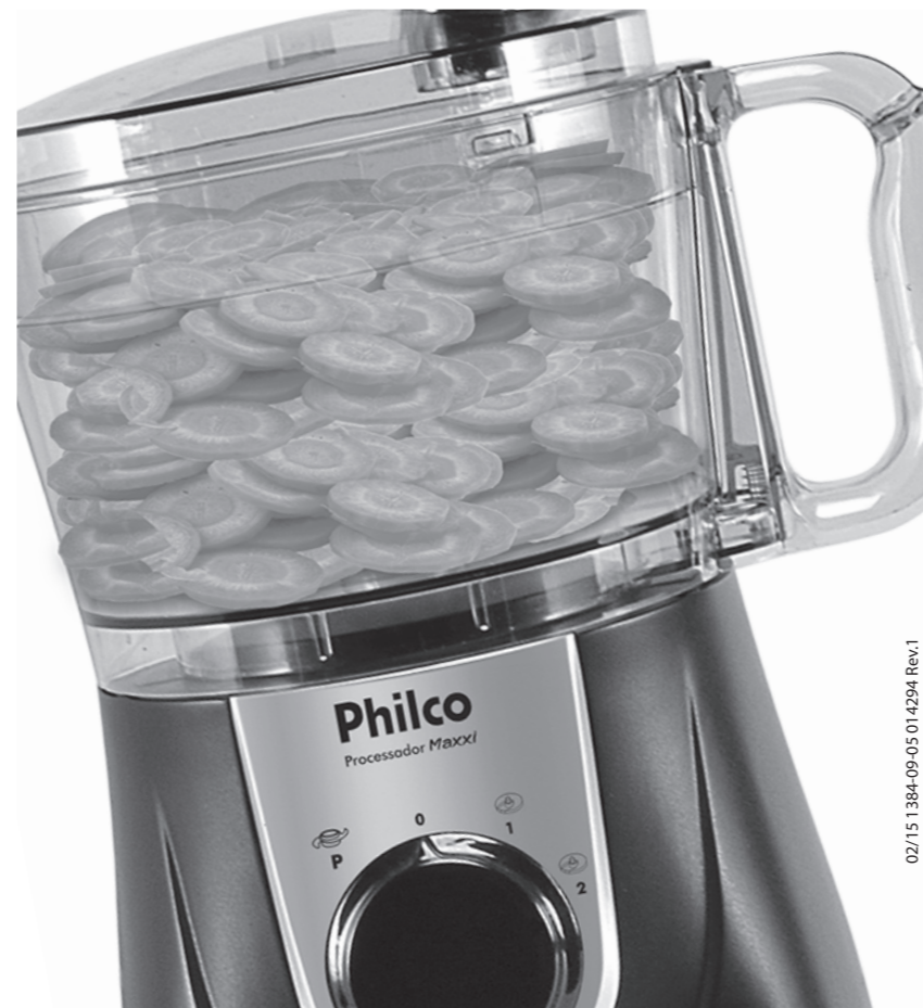
02/15 1384-09-05.01.4294 Rev.1