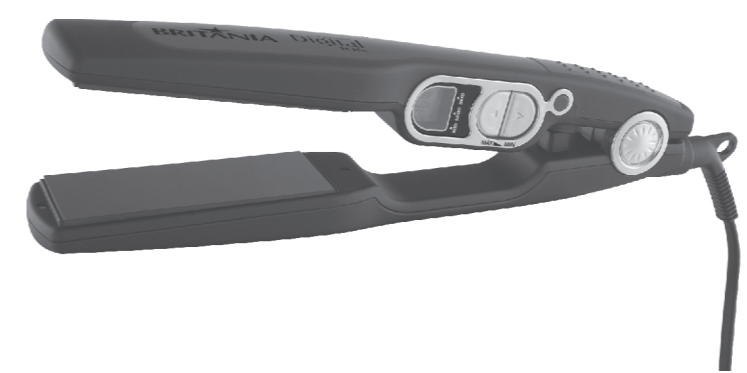
Prancha Ceramic Digital