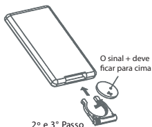
2º e 3º Passo