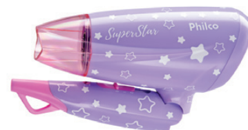
DETALHE DO CABO DOBRÁVEL