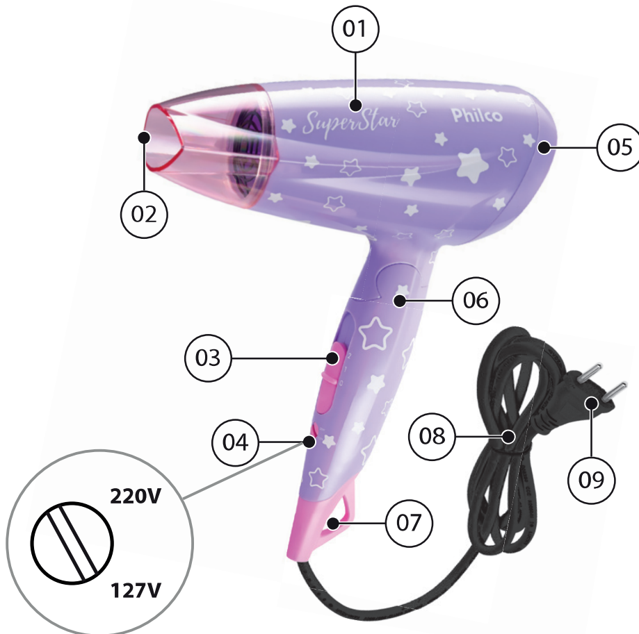
DETALHE DA CHAVE SELETORA DE TENSÃO