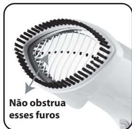
Figura 02: Furos de saída do vapor.