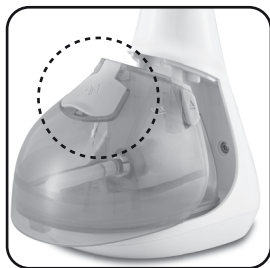
Figura 05: tamapa do reservatório de água