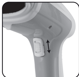
Figura 03: botão de acionamento do vapor e chave trava e destrava botão.