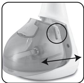
Figura 04: retirando ou encaixando o reservatório de água.

Para encher o reservatório, aperte o botão circulado Figura 04 e puxe o reservatório, abra a tampa do reservatório Figura 05 e encha com água conforme marcações de max. e min. no tanque, e encaixe o reservatório novamente no produto.