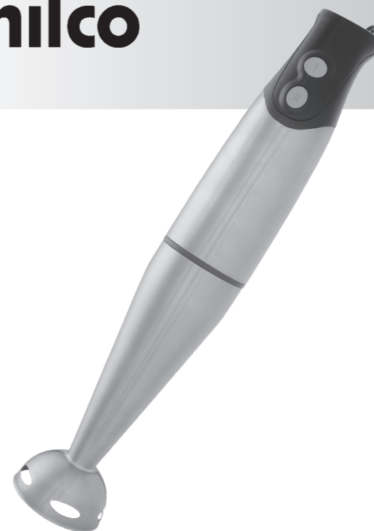
MIXER PRIME PHM01

SOMENTE PARA USO DOMÉSTICO ATENDIMENTO AO CONSUMIDOR 0800-6458300