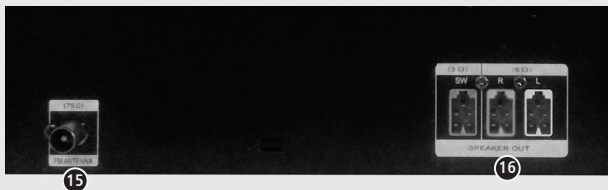
15 ANTENA FM