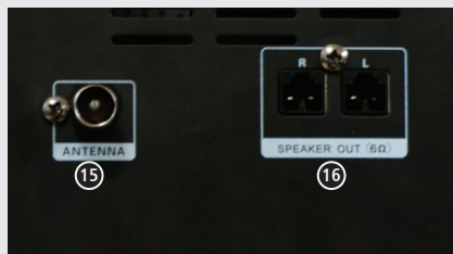
15 ANTENA FM