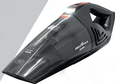
Aspirador de Pó BAS01 BIV