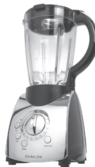
LIQUIDIFICADOR COM COPO DE VIDRO