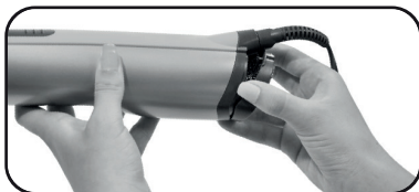
Figura 2: tirando o filtro