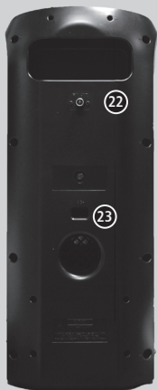
22. CONEXÃO ANTENA FM