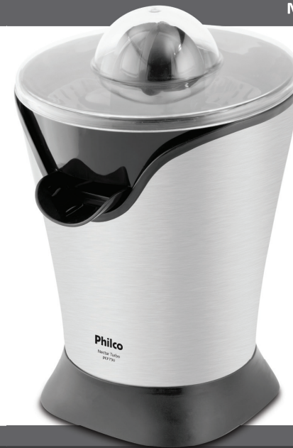
ESPRESSOR DE FRUTAS NECTAR PEF750 Nectar Turbo

PARABÉNS, VOCÊ ACABA DE ADQUIRIR UM PRODUTO DE QUALIDADE PHILCO!