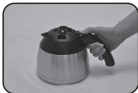
Figura 2: aperte a lingueta para servir o café