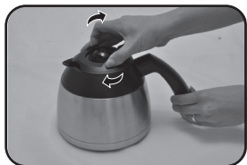
Figura 1: gire no sentido horário para fechar

Nota: O café tende a perder calor rapidamente quando servido em dias muito frio, o mesmo pode acontecer quando for servido em pouca quantidade e em xícaras muito grande, neste caso; recomenda-se utilizar xícaras com tamanho apropriado à dose do café desejado e consumir o café logo após seu preparo, ou ainda, servir uma quantidade maior de café.