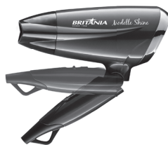
DETALHE DO CABO DOBRÁVEL