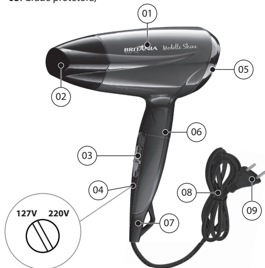
DETALHE DA CHAVE SELETORA DE TENSÃO